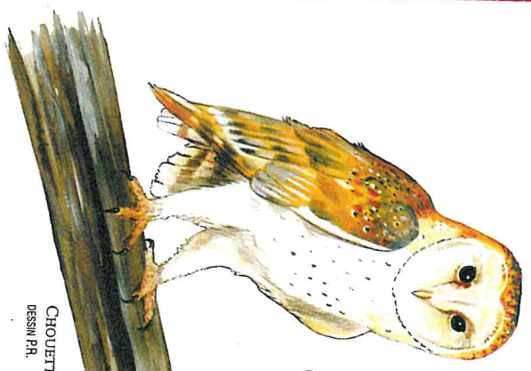
CHOUETTE EFFRAIE / DESSIN PA