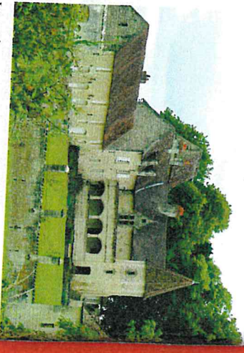
LE CHÂTEAU DE LA MASSARDIÈRE

galerie et d'une chapelle. Des dépendances furent construites au XVIII e siècle, délimitant une cour, fermée par une balustrade.